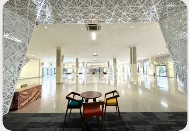
Hall Lt. 1 Gd. Animasi & Promosi (Kapasitas 800 orang)