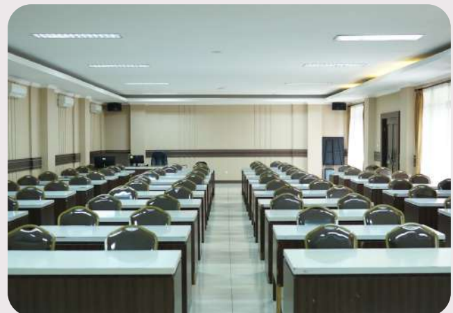
Aula Pertemuan (Kapasitas 100 Orang)