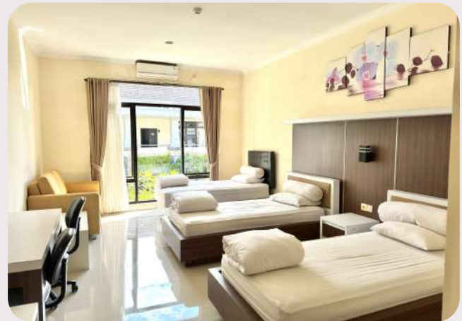
Asrama (Isi 3 bed/2 bed, AC, Wifi, TV, KM Dalam)