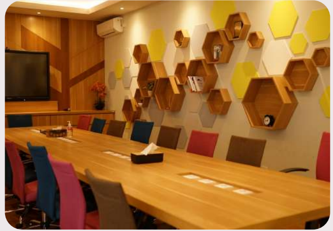
Ruang Meeting LSP (Kapasitas 20 Orang)