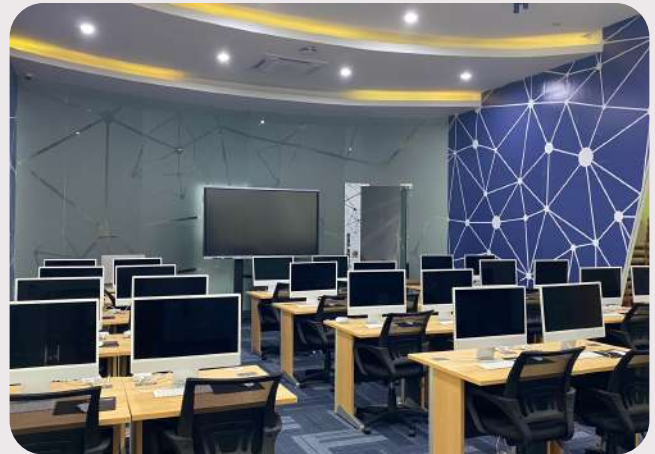
Laboratorium i-Mac (Kapasitas 24 Orang)