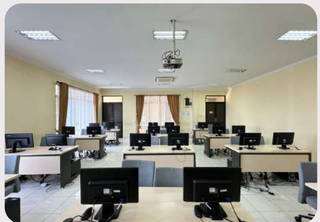
Laboratorium Komputer (Kapasitas 24 Orang)